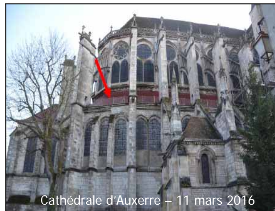
Cathédrale d'Auxerre – 11 mars 2016

Le risque majeur lors de ces opérations de restauration est l'introduction de flammes nues ou de particules incandescentes dans des structures en bois très anciennes que sont notamment les charpentes. Les travaux dits par points chauds sont ici particulièrement dangereux. On entend par travaux par points chauds ceux qui mettent en œuvre des postes de soudure, des chalumeaux pour des opérations de coupage, d'oxycoupage ou d'étanchéité, des appareillages de meulage, ou des disqueuses etc. Ces opérations sont d'ailleurs la cause de nombreux incendies en milieu industriel. L'incendie est d'autant plus insidieux qu'il peut couvrir plusieurs heures avant de se déclarer, et donc d'être découvert, parce que la flamme d'un chalumeau, des particules de soudure, des morceaux métalliques portés à haute température projetés ou découpés ou des produits bitumineux en feu, peuvent initier des phénomènes de feu couvant dans des zones confinées, et notamment dans des nœuds de charpentes, qui vont dégénérer à la faveur du premier appel d'air. Les procédures de prévention et protection doivent être d'autant plus draconiennes dans les bâtiments anciens, que leurs charpentes sont très sèches donc