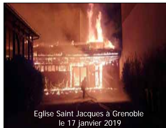
Eglise Saint Jacques à Grenoble le 17 janvier 2019