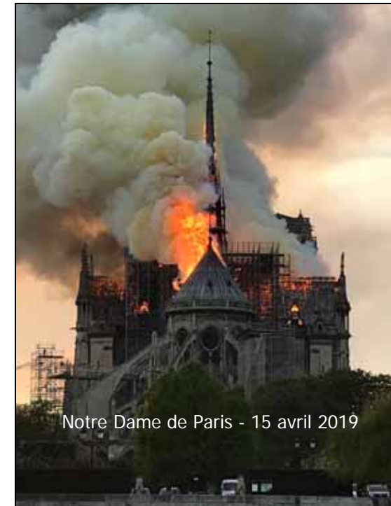
Notre Dame de Paris - 15 avril 2019