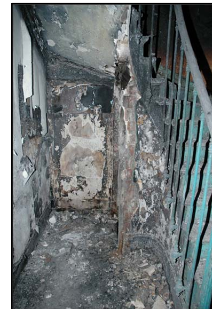
Paris, boulevard Auriol. Départ de feu dans la cage d'escalier au niveau de poussettes, 17 morts.