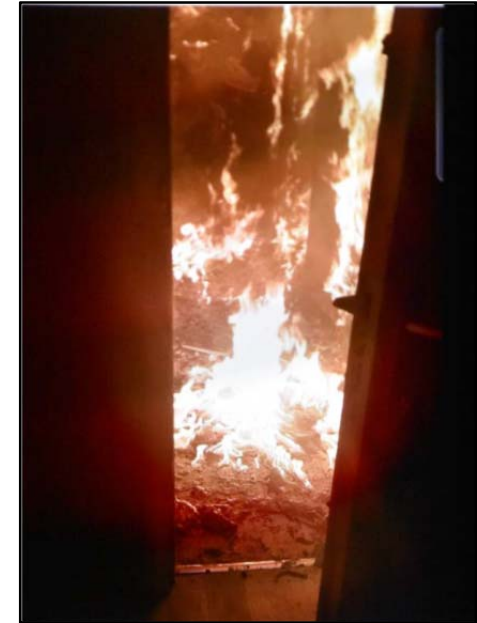
Semur-en Auxois : découverte d'un départ d'incendie sur le palier d'un appartement.

L'encloisonnement d'une cage d'escalier consiste à installer une porte palière à chaque étage et est obligatoire dans toutes les copropriétés dont la hauteur de l'immeuble dépasse les 8 mètres (2 ème , 3 ème et 4 ème famille).