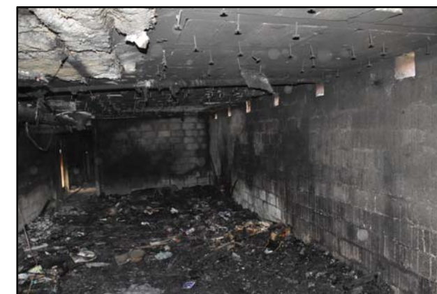
Zone origine, départ de feu dans les caves.