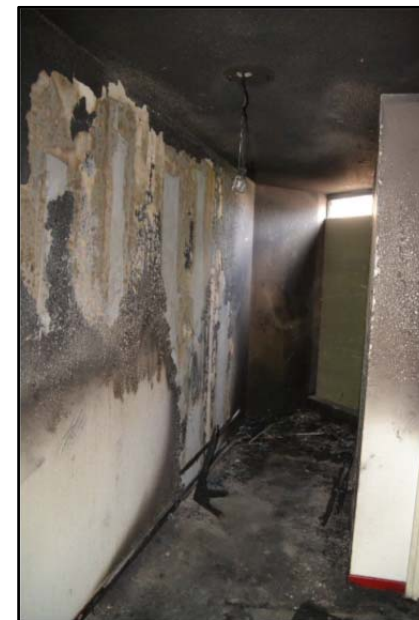
Marseille : épandage d'accélérant dans un couloir