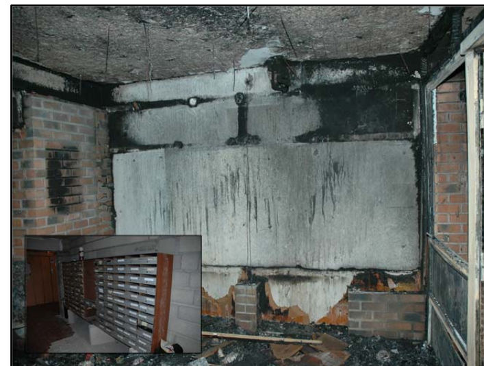
Hall d'entrée de la tour, origine de l'incendie au niveau de boîtes aux lettres.