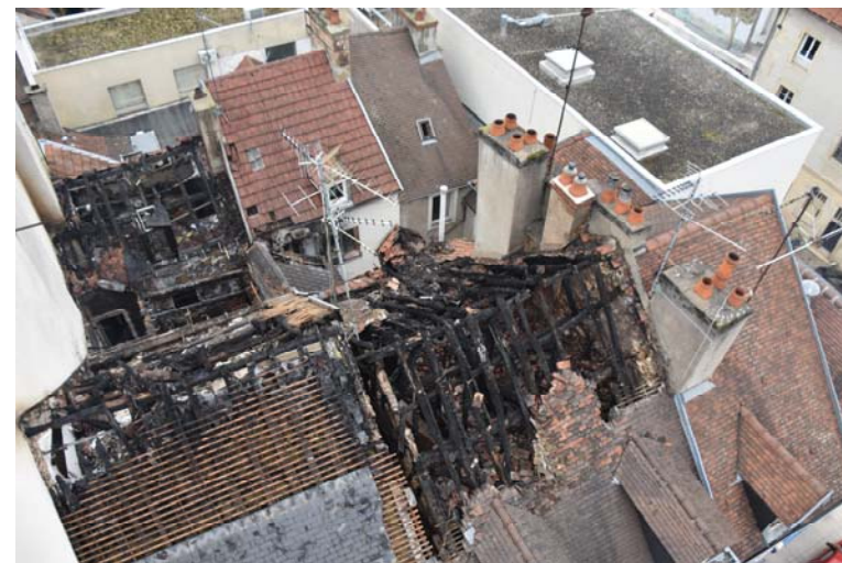
Dijon : départ de feu au niveau de containers poubelles à la base d'un escalier. 1 mort.

La réglementation mise en place par l'arrêté du 31 janvier 1986 et mise à jour en 2005 impose que toutes les familles d'immeubles disposant de celliers, de local poubelle si celui-ci ne s'ouvre pas sur l'extérieur ou de caves indépendants des logements doivent être équipés de bloc-portes coupe-feu : de degré une demi-heure, ouvrir dans le sens de la sortie en venant des celliers ou des caves, être munis d'un ferme-porte et ouvrables sans clé de l'intérieur. Les immeubles d'habitation collective à partir de 4 étages doivent être équipés de blocs portes coupe-feu dans les escaliers permettant la communication entre le sous-sol et le reste du bâtiment. Les portes palières d'appartements peuvent également être coupe-feu afin de retarder la propagation des flammes lors d'un incendie mais ce dispositif n'est pas obligatoire.