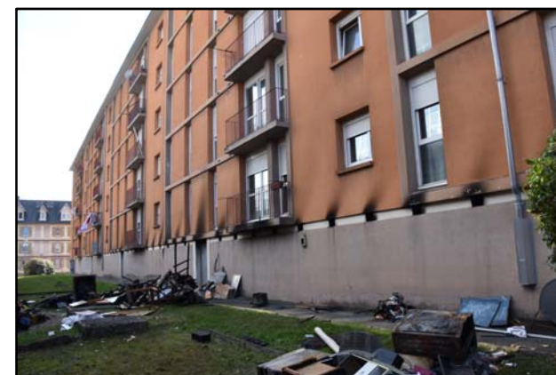
Belfort, départ de feu dans les caves. 60 résidents évacués.