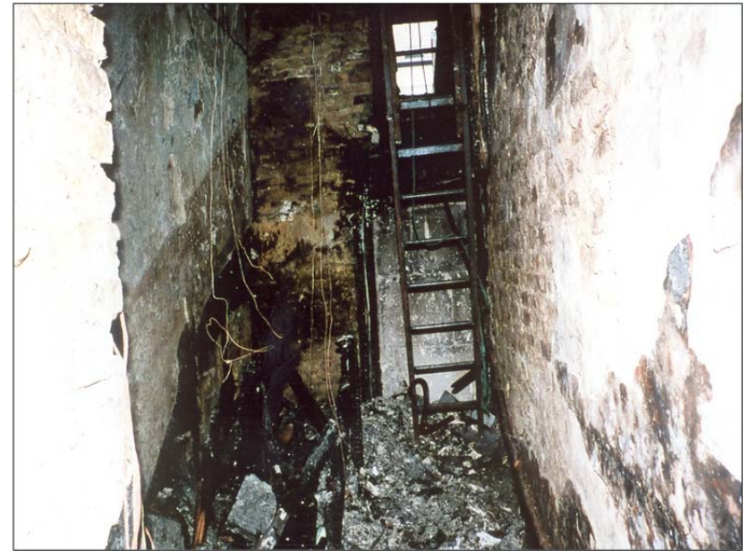
Calais, départ de feu à la base de la cage d'escalier ; 3 morts.

Les colonnes sèches sont des dispositifs de lutte contre l'incendie installés dans des immeubles comprenant des étages ou des sous-sols, consistant généralement en une canalisation vide qui peut être raccordée en extérieur à une source d'eau pressurisée. Ces canalisations verticales, (si elles ne sont pas détériorées ou vandalisées) alimentent, en cas d'incendie, tous les étages en eau sous pression, ce qui permet aux pompiers d'être beaucoup plus efficaces. Elles sont obligatoires pour les immeubles de plus de 7 étages (3 ème et 4 ème famille).