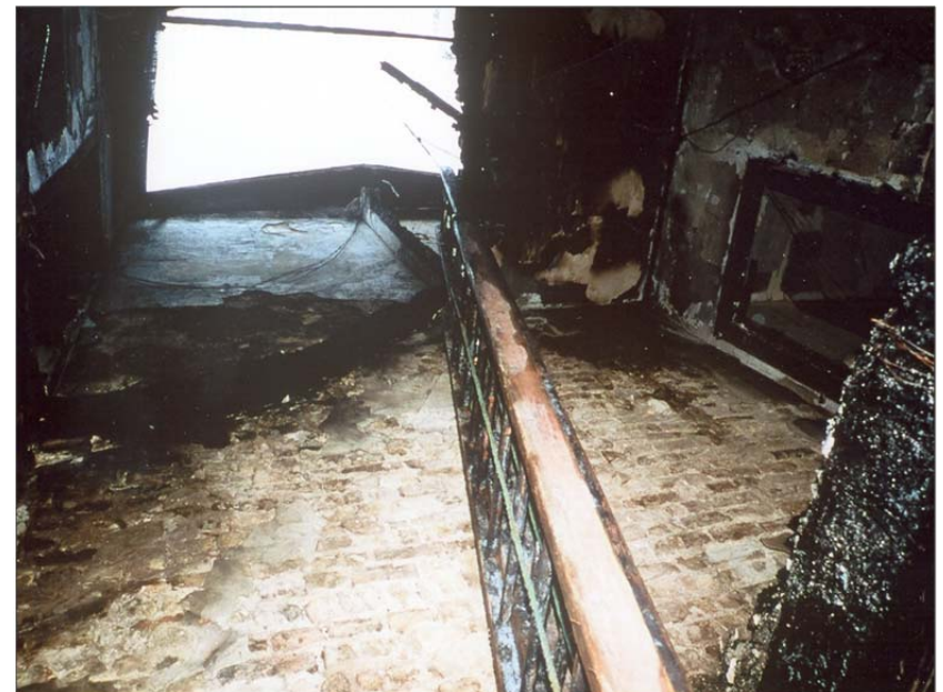
Même cage d'escalier après l'incendie.