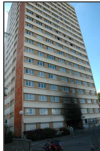
Tour de l'Haÿ-les-Roses